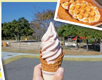
ハニカムクロップル¥230~