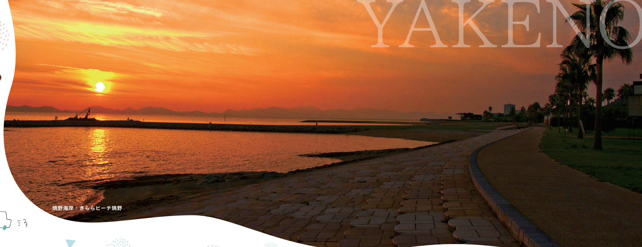
焼野海岸・きららビーチ焼野