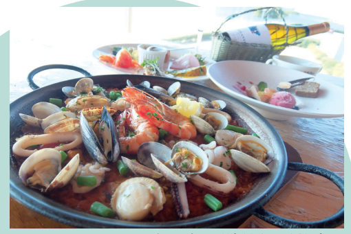
パエリアランチ ¥2,500 ※サラダ・スープ・パン付 (ご注文は2名様~)

隈研吾氏による設計の、自然と調和した開放感抜群のレストラン。人気のパエリアは、大きな海老をはじめ、ムール貝やホタテなど彩りも楽しい逸品です。