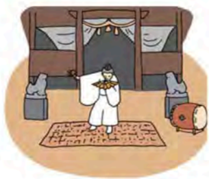
萩市指定無形民俗文化財

若宮神社は木間地区の氏神様です。ここで年に一度8月15日に奉納されているのが萩市民俗無形文化財の「神代の舞」です。五穀豊穡を祈願するための神楽舞で、継承の中心となっているのは木間神代の舞保存会です。