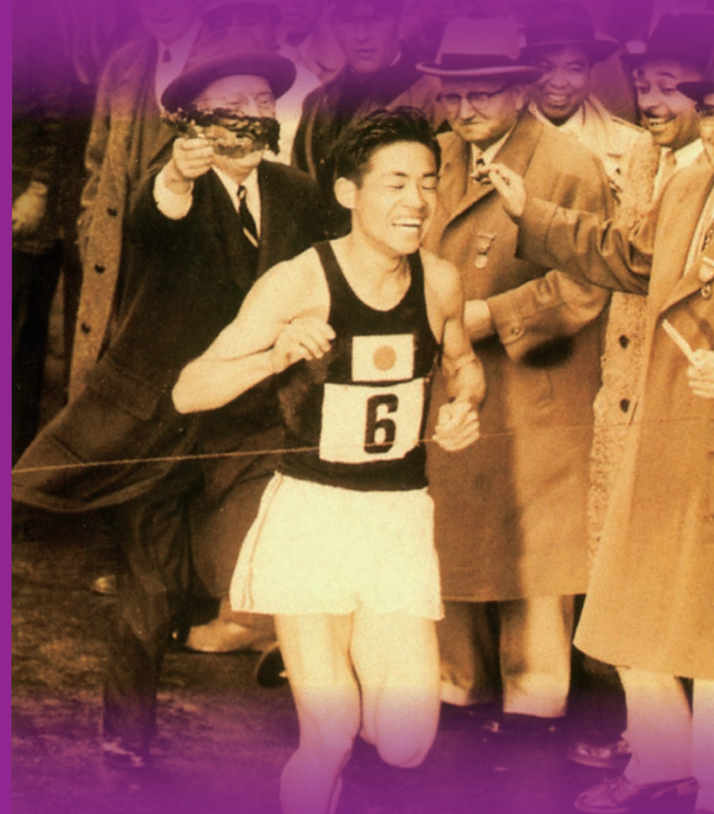
昭和30年のポストンマラソンで ゴールした瞬間の写真 左上は月桂冠を手にしたポストン市長