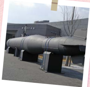
阿多田交流館(平生町)