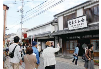
金子みすゞ記念館