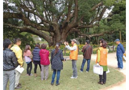
国指定天然記念物 川棚のクス