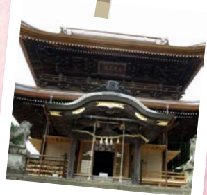
花岡八幡宮(下松市)