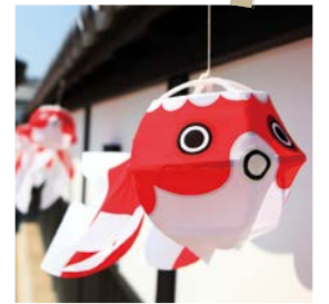
金魚ちょうちん(柳井市)