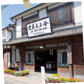
金子みすゞ記念館(長門市)