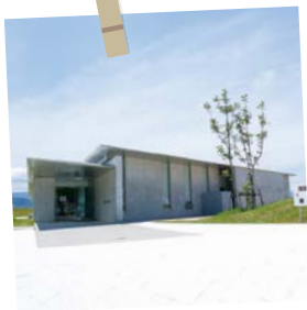
星野哲郎記念館(周防大島町)