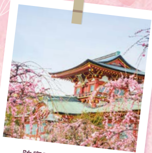
防府天満宮(防府市)