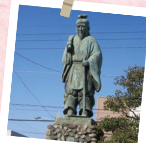
寝太郎像(山陽小野田市)