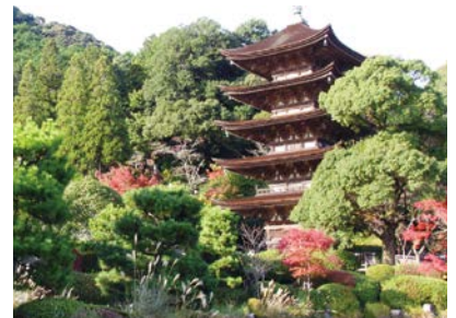
国宝瑠璃光寺五重塔