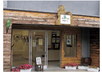
まちぐるみギャラリー