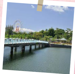
ときわ公園(宇部市)