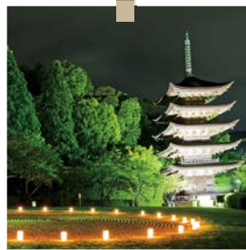
山口ゆらめき回廊(山口市)