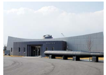
阿多田交流館と人間魚雷回天のレプリカ