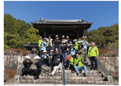
【昌福寺山門】幕末の奇兵隊(倒幕サバゲーム)で集合