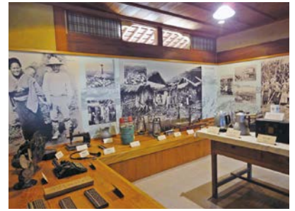
日本ハワイ移民資料館