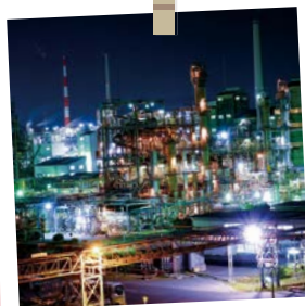
周南工場夜景(周南市)