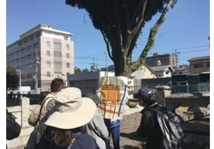
ガイドの様子(徳山地域)