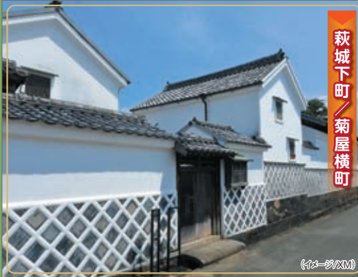
萩城下町 菊屋横町

(注3) 角島灯台の参観料が全300円(中学生以上)は旅行代金に含まれません。 (イターゾウXM)