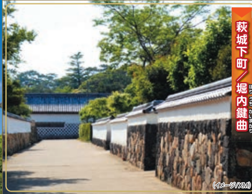
萩城下町 堀内鎌曲