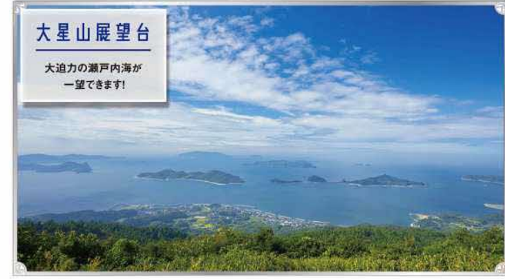
大星山展望台 大迫力の瀬戸内海が一望できます！