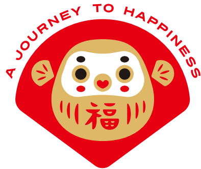
[シンボルマークのみ]

ロゴマークは原則として[基本形][横組み][縦組み]のいずれかを使用しますが 例外的に[シンボルマークのみ][キャッチコピーのみ]といった 個別での使用も可とします。