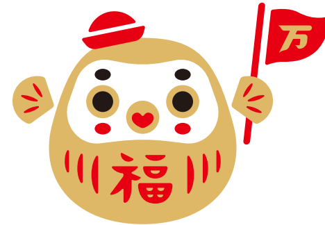
[ふくだるま(ツアーコンダクターバージョン)]