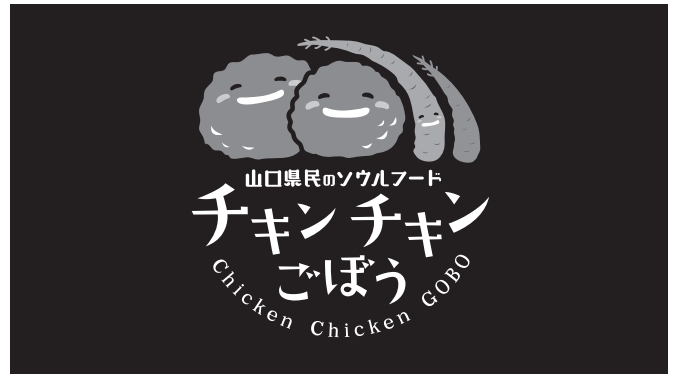
Sub Version 1 Gr