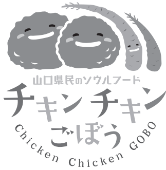
Main Version Gr

グレースケールで使用する場合のデザインをご用意しました。 濃い色の地でグレースケールを使用する場合はタイポグラフィを白で使用してください。