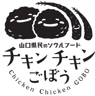
Main Version Mo

モノクロで使用する場合の単色デザインをご用意しました。 濃い色の地でモノクロを使用する場合は、色を白で使用してください。