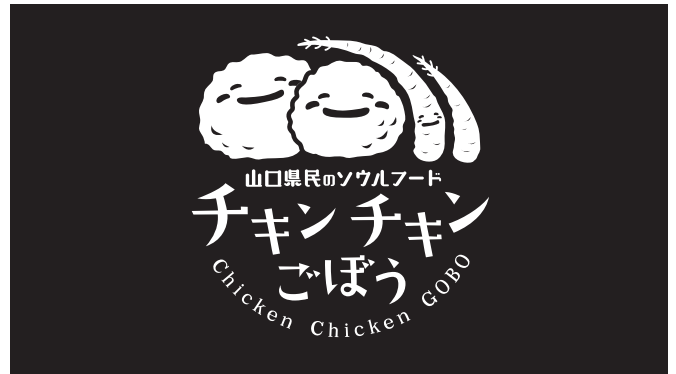
Sub Version 1 Mo