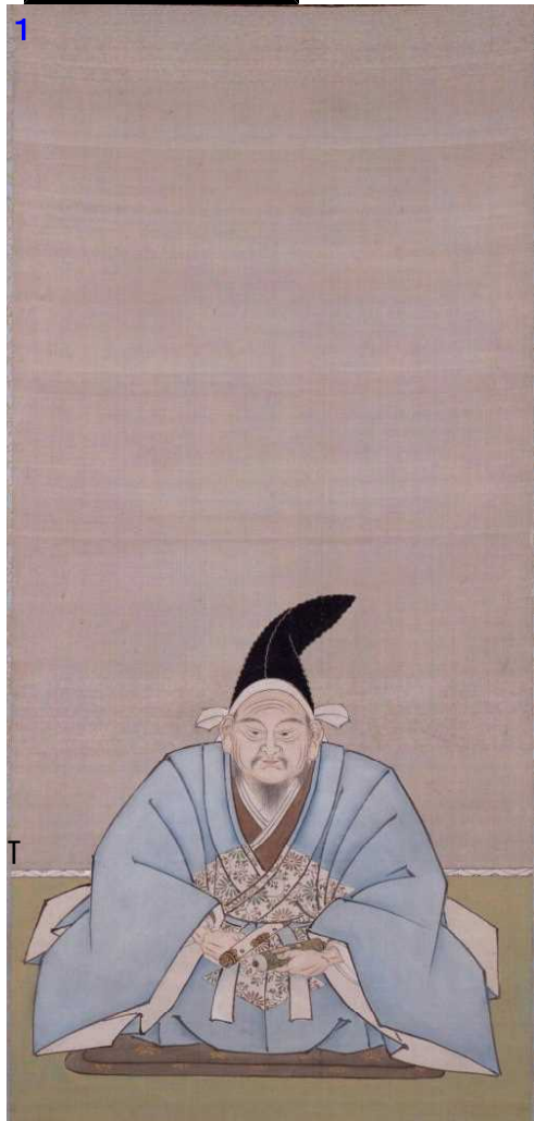
おおえのひろもとぞう